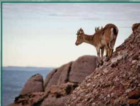
DOMINANT L'HORITZÓ Autor: Sergi Viladot Bacardit