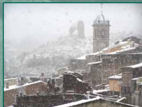
LLUNYANIA Autor: Pere Grima i Noguera