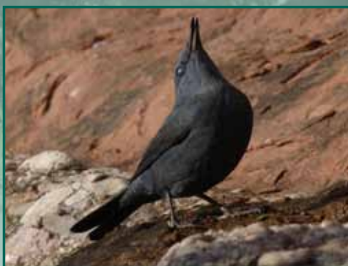
EL BALL DE LA MERLA BLAVA (Monticola Solitarius) Autor: Josep Battle Costa