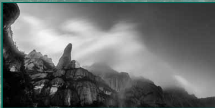
GUARDA NOCTURN Autora: Luísa Díaz Cárdenas