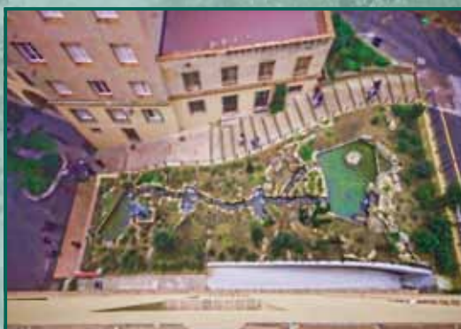
JARDINS Autor: Juan C. Lizancos García