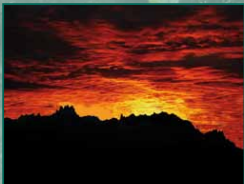
CEL INFERNAL Autor: Josep Lluís Felices Ramon