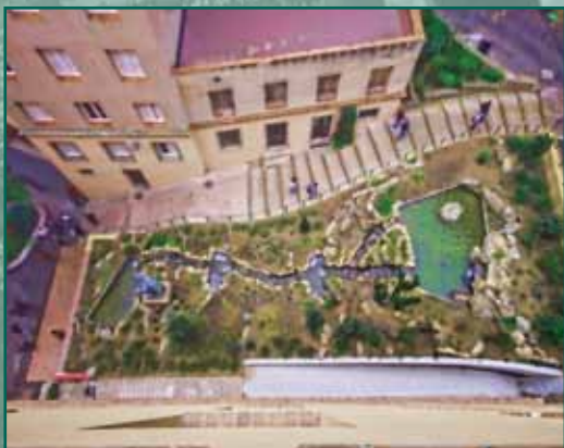
JARDINS