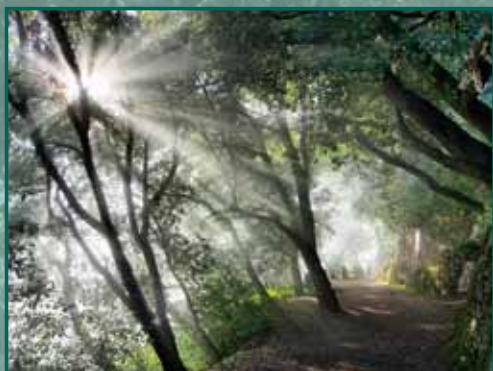
CAMÍ DELS DEGOTALLS Autor: Enric Almirall Pujol

VIII CONCURS DE FOTOGRAFIA DEL PARC NATURAL DE LA MUNTANYA DE MONTSERRAT