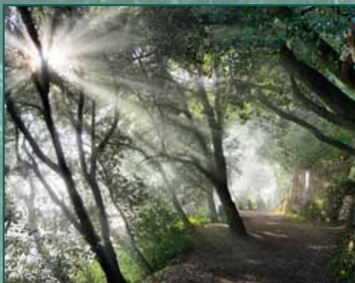
CAMÍ DELS DEGOTALLS / Autor: Enric Almirall Pujol

VIII CONCURS DE FOTOGRAFIA DEL PARC NATURAL DE LA MUNTANYA DE MONTSERRAT