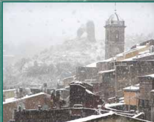
LLUNYANIA / Autor: Pere Grima i Noguera